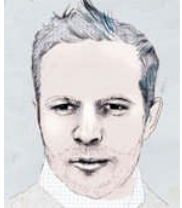
Tyler Brülé: Fast Lane

Der Erfinder von Magazinen wie "Wallpaper" und "Monoclé" ist ein Vielreisender und Kosmopolit. Hier schildert Ihnen Tyler Brülé exklusiv seine ganz persönlichen Eindrücke vom Leben auf der Überholspur. Brülé und weitere Kolumnisten - hier